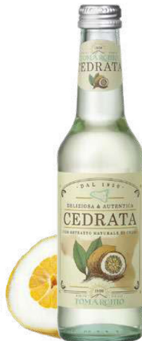
CEDRATA con estratto naturale di Cedro With Lime natural extract