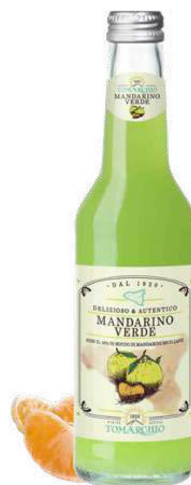
MANDARINO VERDE con il 16% di succo di Mandarini Siciliani With Sicilian Tangerine Juice