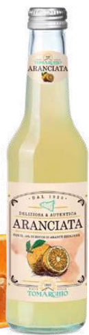
ARANCIATA con il 20% di succo di Arance Siciliane With Sicilian Orange juice