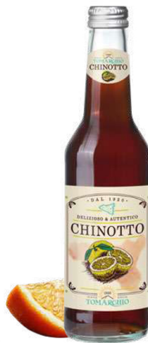
CHINOTTO con infuso di Chinotto With Chinotto extract