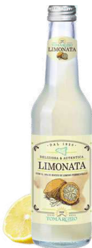
LIMONATA con il 16% di succo di Limoni Femminello With Femminello Lemon Juice